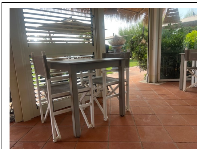
Tavollo bar veranda